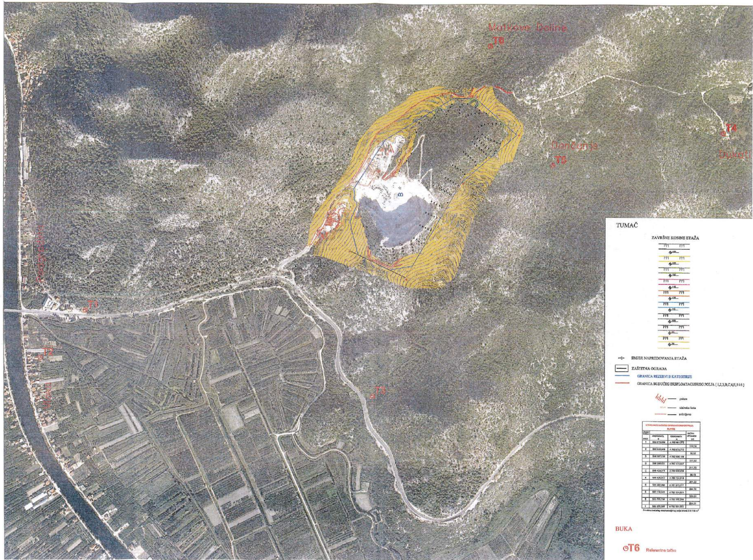
Prilog 3. Prikaz mjernih mjesta buke